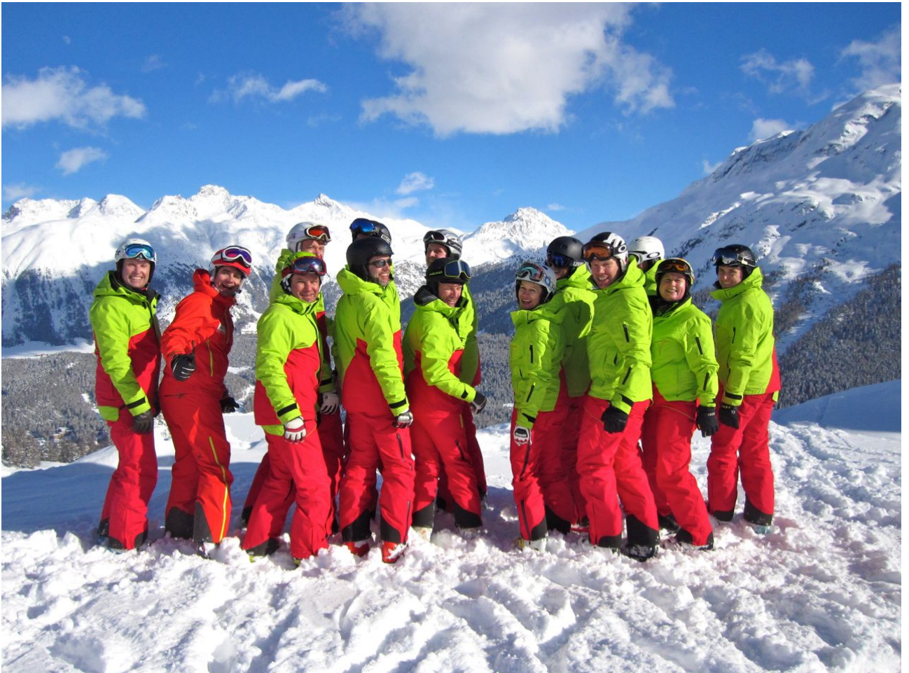
Euer Lehrteam Ski Alpin